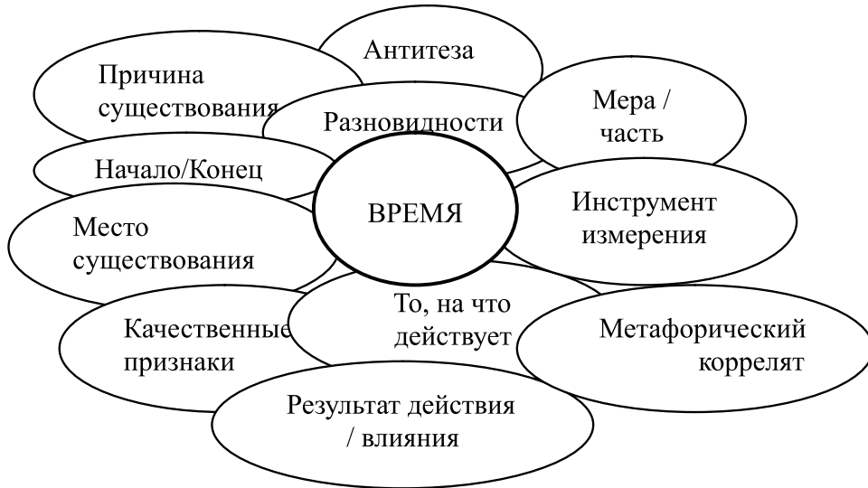
Рис. 1. Матрица доменов концепта ВРЕМЯ

Графически такая матрица может быть представлена в следующей схеме (Рис. 1):